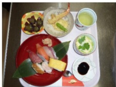
食事風景はこちら↓

9月20日(日)敬老会を行いました。ささやかではありませんが、お祝いの御膳を提供させて頂きました。 握り寿司は、マグロ・ハマチ・サーモン・アナゴ・甘エビ・錦糸巻です。握り寿司の他は、天ぷら・茶碗蒸し・ぶどうです。